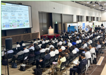
※上記写真は 2025年 8 月に仙台で開催した「第6回 地域×Tech 東北」の様子。